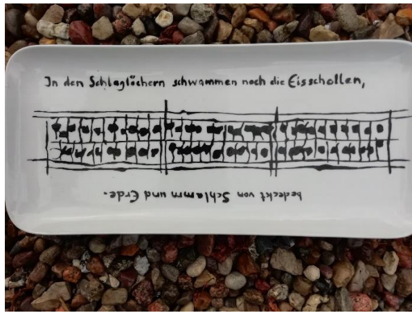
Geschenk zum 50. Geburtstag